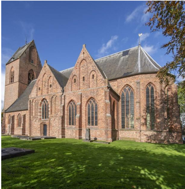
De dorpskathedraal of boerenkathedraal (Petrus en Pauluskerk) van Loppersum.

entslapen. POST TENEBRAS SPERO LUCEM (na de duisternis hoop ik op het licht). Zijn vrouw Menewer was op 2 maart 1607 al overleden en is in dezelfde kerk begraven. 13