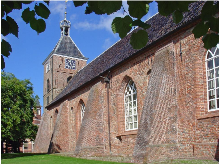
De kerk in Uithuizen staat ten onrechte bekend als de Jacobikerk. Maar niet Jacobus de Meerdere was de kerkheilige, maar de heilige Dionysius.

Het Bolhuis was een edele heerd met 70 grazen land (zo'n 40 hectare) wat maakte dat de familie tot de rijke eigenerfden behoorde. Op hun heerd kon niet alleen het zijlrecht 1 vallen (wat in 1588 ook inderdaad het geval was), ook was er het redgerschap 2 aan verbonden, waarvoor je minstens 30 grazen land moest bezitten.