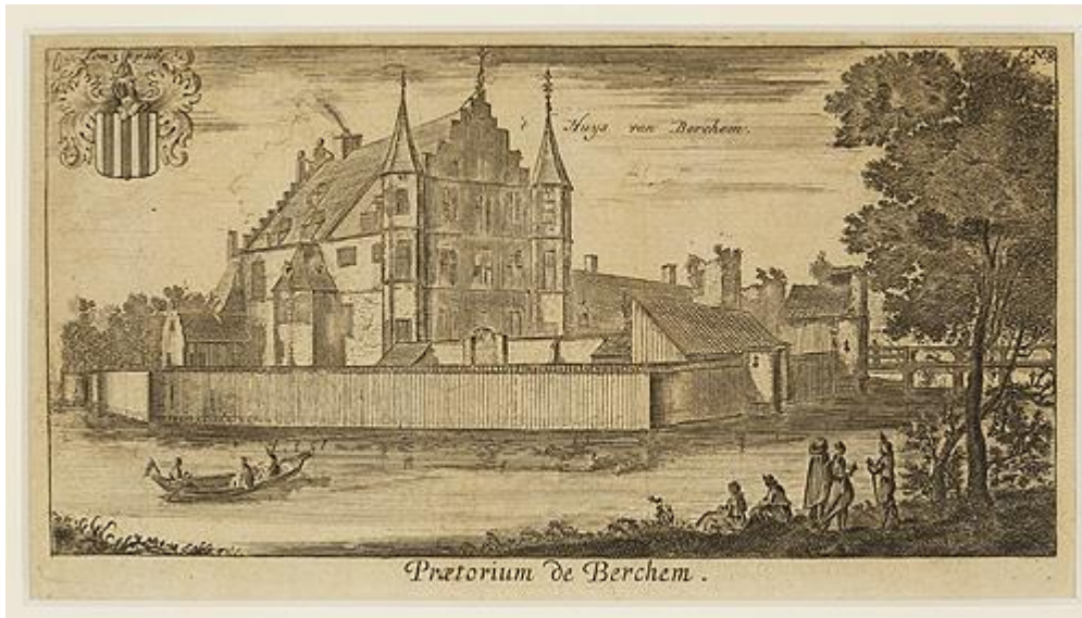
Kasteel van Berchem (ongeveer 1670)