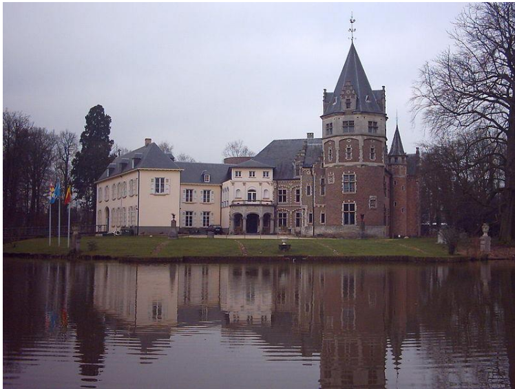
Kasteel van Renesse in het centrum van Oostmalle.

Willem, die te Wommelgem verbleef, bouwde tussen 1431 en 1464 een kasteel te Oostmalle. Van deze burcht is echter niets bekend. De enige zichtbare overblijfselen zijn de donjon die nu het scharnierpunt vormt van het kasteel en de tornooibalk (deurkalf) die nu in de ridderzaal prijkt. In 1542 werd de burcht namelijk verwoest door Maarten van Rossum.