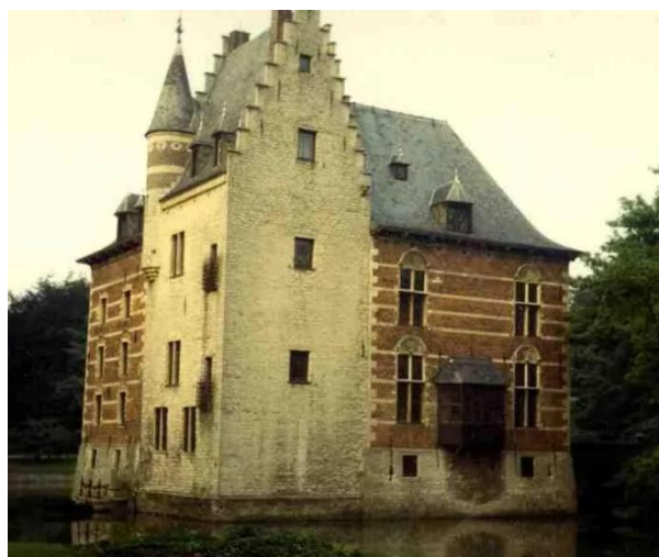
Kasteel van Doggenhout.