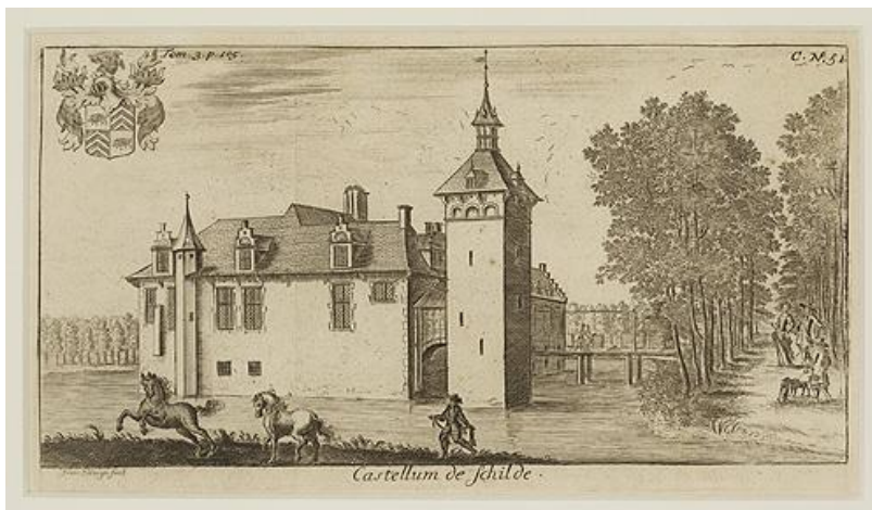
Kasteel van Schilde (ongeveer 1670).