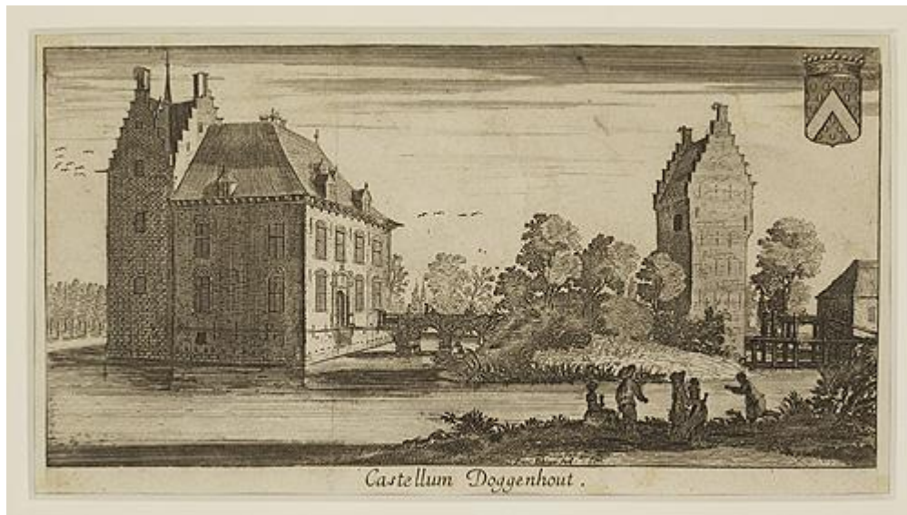
Kasteel van Doggenhout (ongeveer 1670)