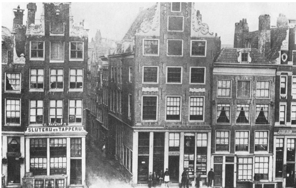
De Halsteeg voor de verbreding in 1868.

De Halsteeg is vernoemd naar een vlees- en vishal aan de oostkant van de Dam. In de middeleeuwen vormde deze Halsteeg een deel van de belangrijkste oost-westas van Amsterdam, die van de Dam naar de Sint Antoniesdijk liep. In een "keurboek" uit 1413, een van de oudste documenten waarin iets over prostitutie in Amsterdam wordt vermeld, staat een keur waarin werd bepaald dat prostituees mochten werken in de Halsteeg en de parallel lopende Pijlsteeg. De Halsteeg kreeg de naam Damstraat na de verbreding in 1868. 6