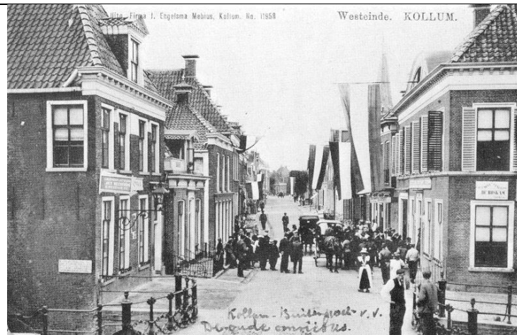
Rechts 'De Roskam' aan de Voorstraat 63, op een ansichtkaart uit 1904. Het gebouw dateert uit 1846. Onder 'De Roskam' anno nu.