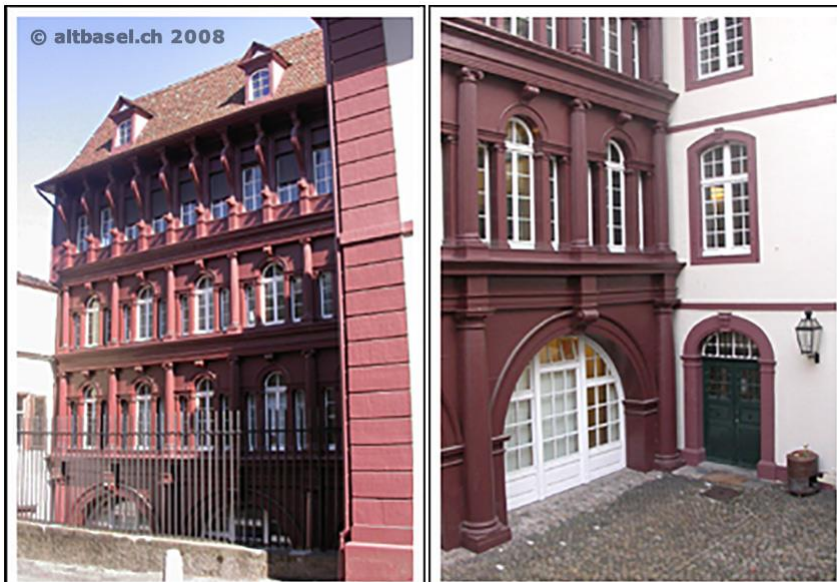
De Spiesshof am Heuberg die Joris, vermoedelijk samen met Joachim van Berchem kocht in 1546. Hier leefde Joris tot zijn dood in augustus 1556. De renaissancevleugel is van later datum. 12