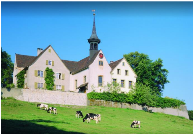
St. Margarethe-Kerk in Binningen.