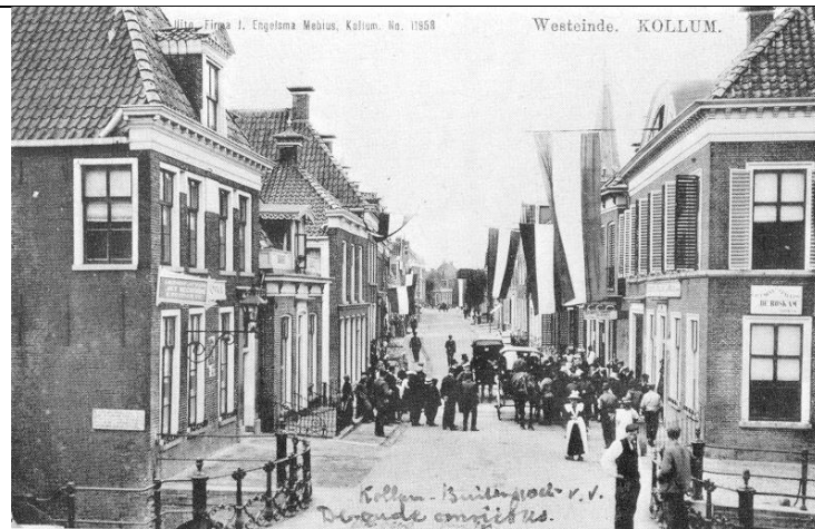
Rechts 'De Roskam' aan de Voorstraat 63, op een ansichtkaart uit 1904. Het gebouw dateert uit 1846. Onder 'De Roskam' anno nu.