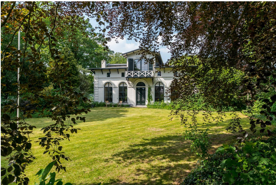
Villa Nova in Makkinga.