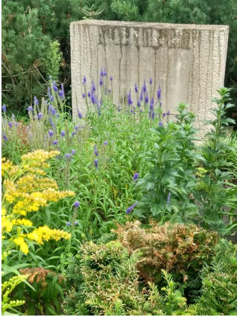
Gedenksteen voor Edo Bergsma op de Oosterbegraafplaats in Enschede.