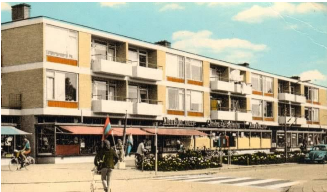
In het midden de supermarkt van Tinus Omvlee. Volgens mijn zus Anja kreeg mijn vader een Volkswagen mee om een weekje met het gezin met vakantie te gaan. Zie de foto op blz. 10.