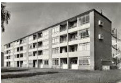
Flat aan de Warmeerweg. Het gezin van Gerrit woonde rechts onderaan (eerste en tweede verdieping). Zijn ouders woonden in het midden van de flat, ook op de begane grond en eerste verdieping.

Op 21 oktober 1962 verhuisde het gezin naar de Warmeerweg 50, ook in Emmermeer, waar zij in 1966 88,15 gulden huur betaalden. Blijkbaar werd de huur door iemand opgehaald, want klachten inzake onderhoud konden aan hem of haar worden meegegeven.