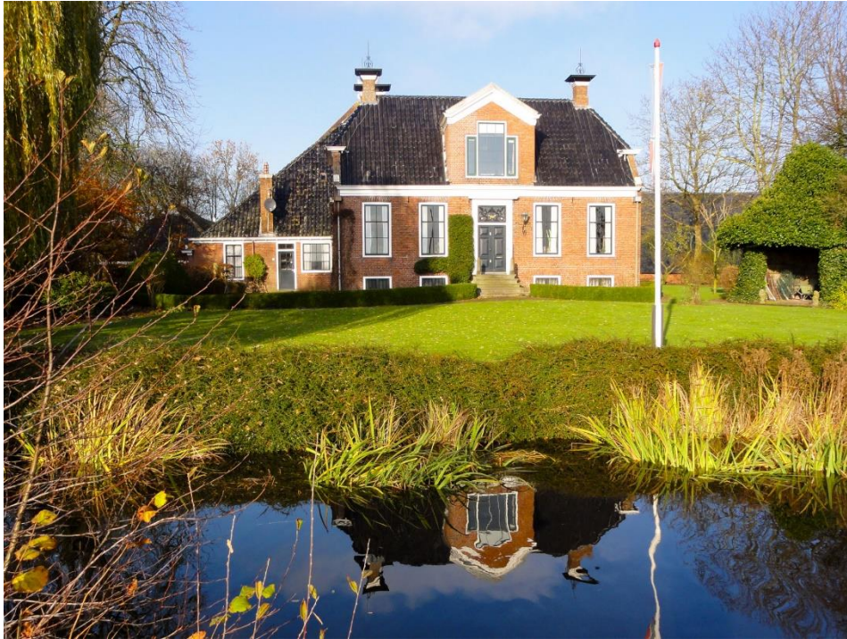
De Huningaheerd in Eenrum, met het jaartal 1820.

huwelijk zullen zijn half en half. Sterven zijn kinderen vóór hem, dan zal de bruidegom over zijn goederen vrij mogen beschikken. Wanneer uit dit huwelijk nog kinderen worden geboren, dan zullen deze gelijk gerechtigd zijn in de nalatenschap van hun ouders.