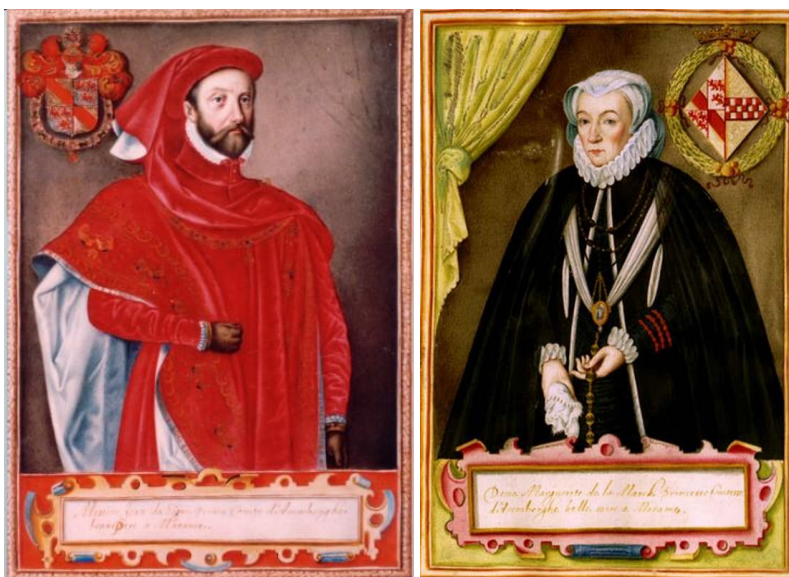
Jean de Ligne, graaf van Aremberg en Margaretha van der Marck..

In 1561 ging het huis over in handen van stadhouder 5 Jean de Ligne, graaf van Aremberg (ca1525-1568), en Margareta van der Marck, gravin van Aremberg, met wie hij in 1547, door toedoen van keizer Karel V, was getrouwd. In het huwelijkscontract was geregeld dat Jan de naam en het wapen van Aremberg zou overnemen. Dit alles inclusief de jaartaks, drie vaten boter, hoenderpacht, het Weertshuis, de windmolen, in het huis aanwezige geschut en munitie en drie stukken grof geschut in Groningen. Filips II gaf hier toestemming voor en dus kreeg Westerwolde een Spaansgezinde leenheer.