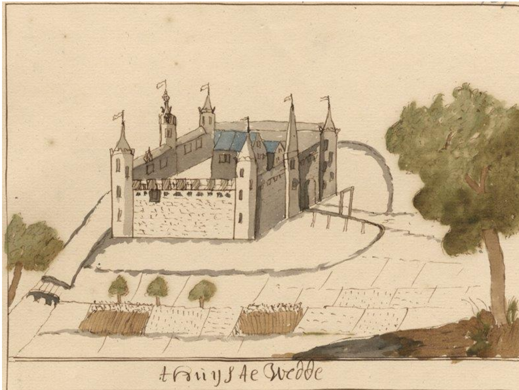
De Wedderborg rond 1700.

ambtenaren aan wie het bestuur en rechtspraak over de heerlijkheid was opgedragen met aan de top de drost die zetelde in de borg te Wedde.