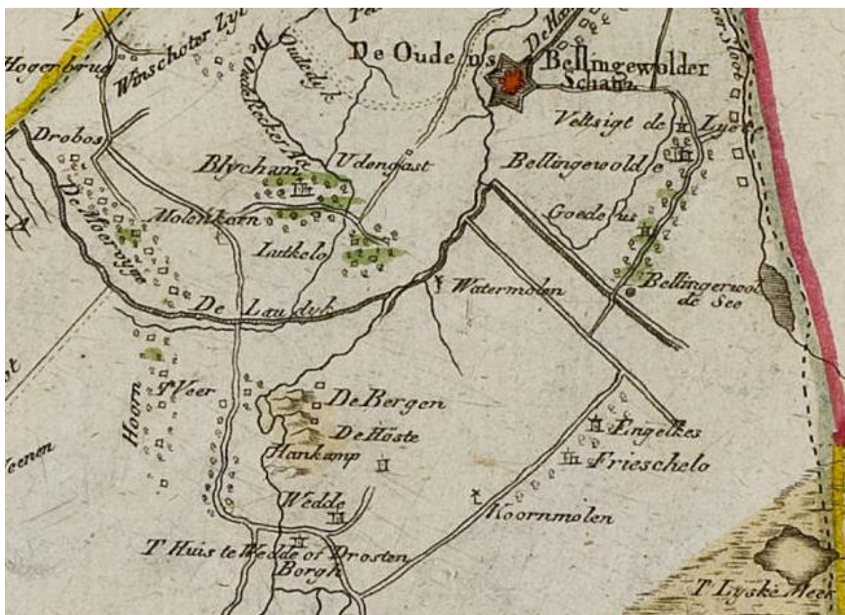
Karte 640: Westerwolde (1791); ingekleurde versie RUG te downloaden via: http://facsimile.ub.rug.nl/cdm/ref/collection/Kaarten/id/1642 .