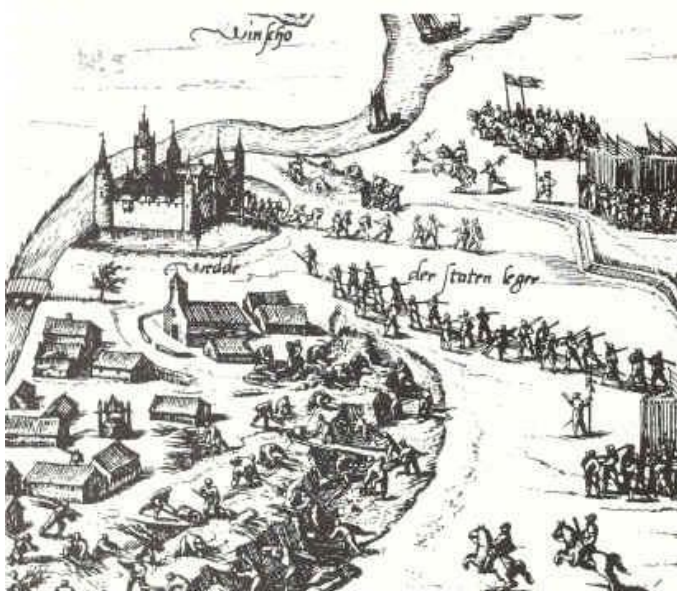
De inname van de borg te Wedde, 30 augustus 1593.

De jaren daarna werd de borg meerder malen geplunderd door zowel Spaans als Staatse legers. Op 30 augustus 159 werd de borg definitief ingenomen door Willem Lodewijk.