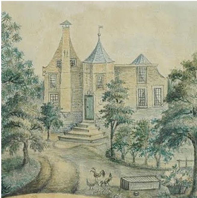
Huis te Wedde.

Als het Reiderland, in het noordoosten van Groningen, in de nacht van 15 op 16 januari 1362 door de (tweede) Marcellusvloed deels door het water wordt verzvolgen en Westerwolde nagenoeg aan zee komt te liggen vraagt de in het Reiderland woonachtige familie van hoofdelingen (of jonkers) Addinga aan de abt van het klooster Corvey (aan de Weser) of ze land 'in leen' kan krijgen. Egge Addinga krijgt toestemming om op een van de landen in het stroomdalgebied van de Westerwoldse Aa een steenhuis te bouwen.