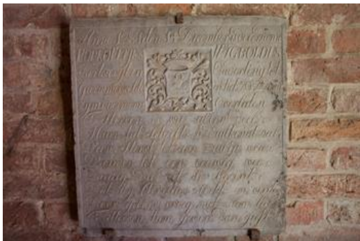
Grafsteen Popke Eltjes Wigboldus in de toren van de kerk in Garmerwolde.

Beschouw O sterveling dees steen Hier rust mijn vlees en been En hoopt hierna weer op te staan Om met den bruidegom te gaan Ten jongsten dag in 't Hemelrijk Om daar te leven eeuwiglijk