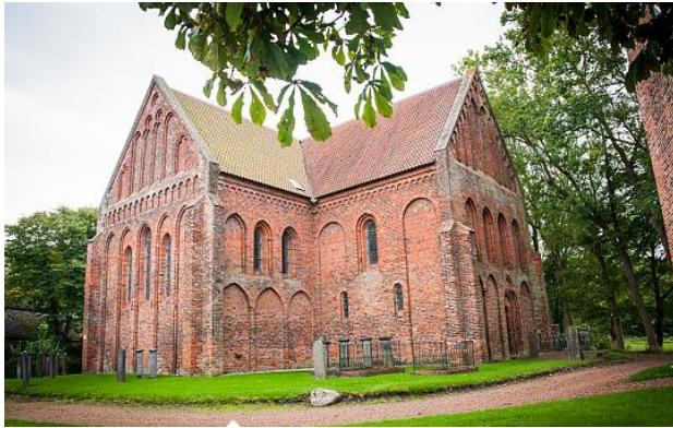
Kerk van Garmerwolde.

De kerk van Garmerwolde is van oorsprong een laatromaanse kruiskerk, gebouwd samen met de vrijstaande toren aan het einde van de 13e eeuw. Tijdens de Reductie van Groningen (1594) werd alles wat aan de rooms-katholieke eredienst herinnerde verwijderd, behalve de piscina. Het schip is in de 19e eeuw gesloopt, wat rest zijn dwarsschip, viering en koor. De kerk heeft een Van Oeckelenorgel.