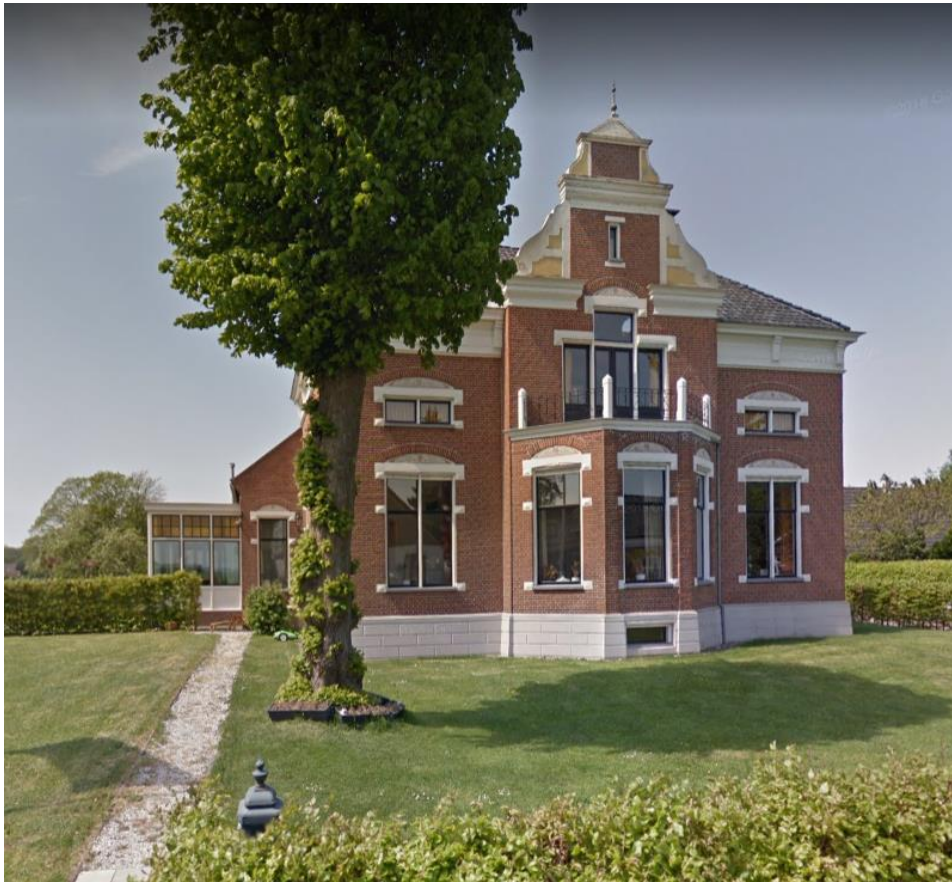
Hoofdstraat 77 in Noordbroek.

Eltje was landbouwer op een boerderij aan de Hoofdstraat 77 in Noordbroek.