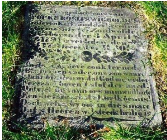
Grafsteen in Zuidwolde.

Maar bidden wij, dat God ons weder Vereend boven 't stof der aard. Ontviel ons aan ons minnend harte een dierbre schat. O, welk gemis! Doch weten wij ook in die smarte Dat 's Heeren wil steeds heilig is. 7