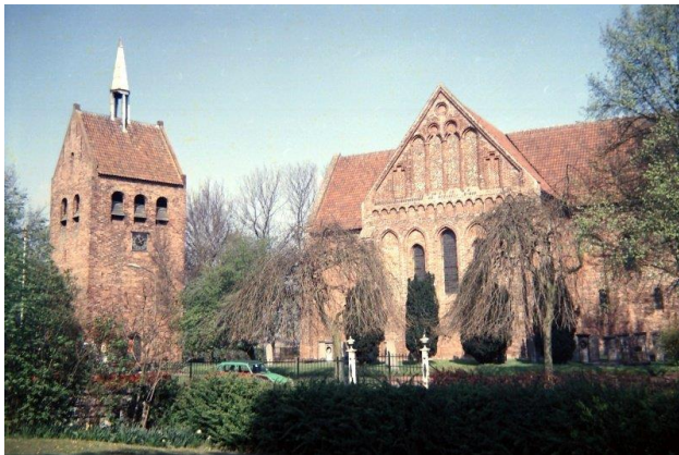
Kerk van Garmerwolde.