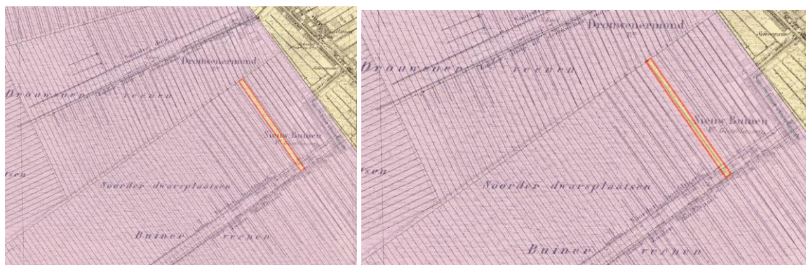
Perceel 12 (links) en 15 (rechts) in 1832.

Oostma ging in beroep, maar dat werd in cassatie verworpen. Hij stierf in 1881 in de gevangenis in Leeuwarden