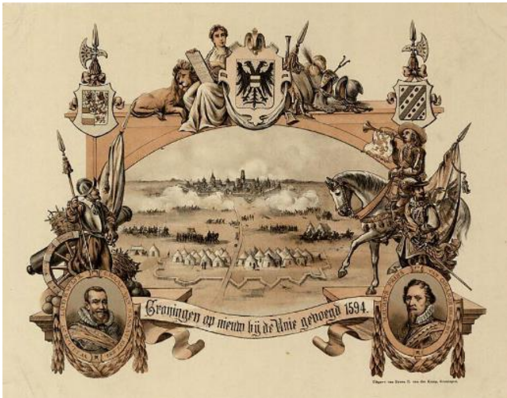
Herdenkingsplaat 1894

Op alle kloostergoederen wordt beslag gelegd en de inkomsten komen ten goede aan het nieuwe bewind.