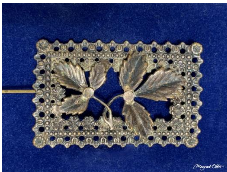
Dit is de broche die Biewkje op bovenstaande foto draagt. Deze is nu in het bezit van Margreet Otto-Wilschut. 1