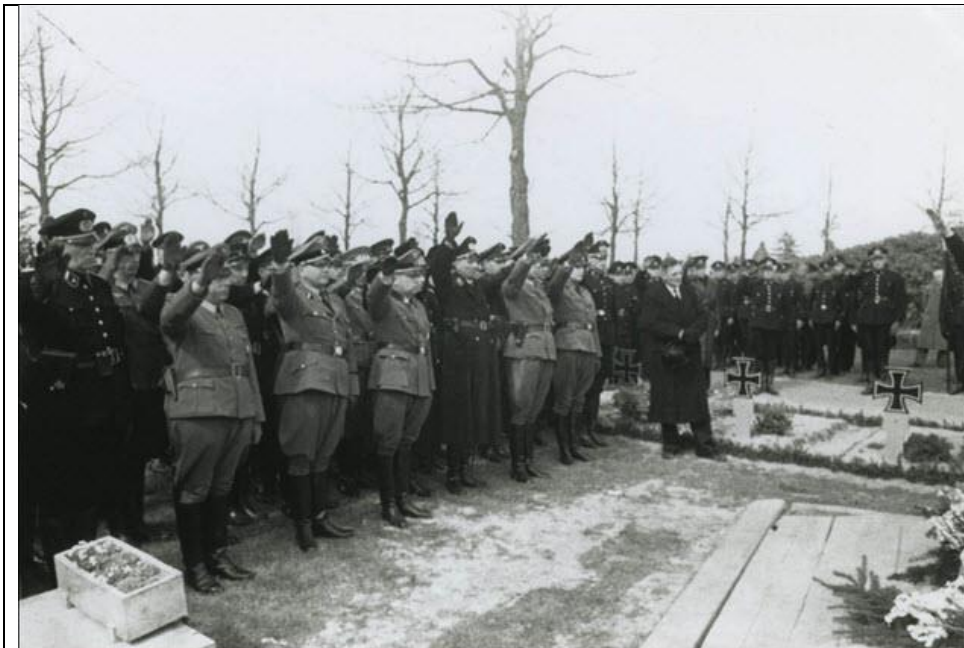
Politiefunctionarissen en andere geuniformeerden brengen de Hitlergroet bij het graf van de geliquideerde politiemajoor Keijer.