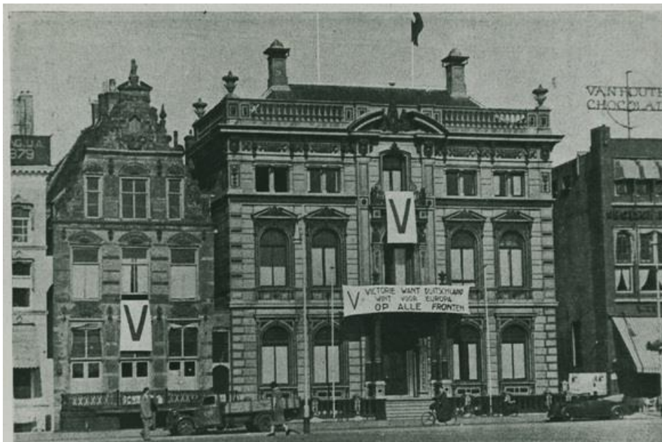
Het Scholtenhuis op de Grote Markt in 1940 met een spandoek van de V-actie aan de gevel.