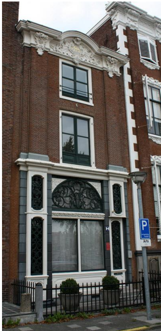
Het Koetshuis aan de Ossenmarkt in Groningen

iemand die zich graag door anderen laat leiden om daarmee zichzelf, bewust of onbewust vrij te pleiten van schuld. Voor de lezer van de verhalen doemt het beeld op van een tamelijk karakterloze meeloper, die zich verschuilt achter anderen. Vanaf de herfst van 1944 kreeg hij een toelage van 50 gulden op zijn salaris, omdat hij bij de SD werkte.