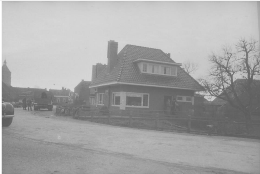
Agenten van Sicherheitsdienst of -polizei staan voor het huis Zonnehoek aan de Brouwerslaan in Middelstum.